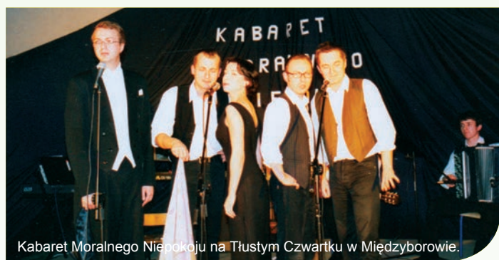
Kabaret Moralnego Niepokoju na Tłustym Czwartku w Międzyborowie.