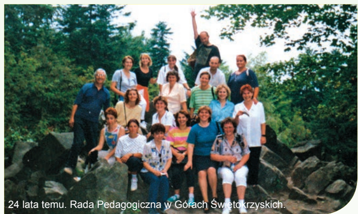
24 lata temu. Rada Pedagogiczna w Górach Świętokrzyskich.