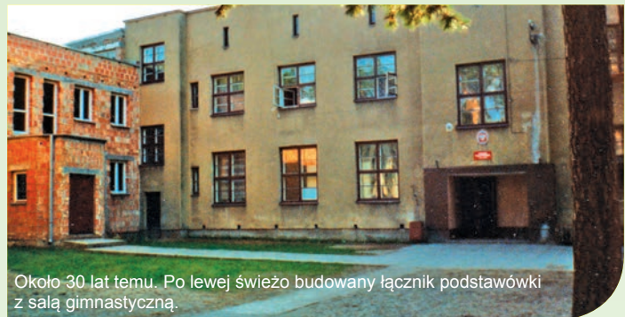
Okolo 30 lat temu. Po lewej świeżo budowany łącznik podstawówki z salą gimnastyczną.